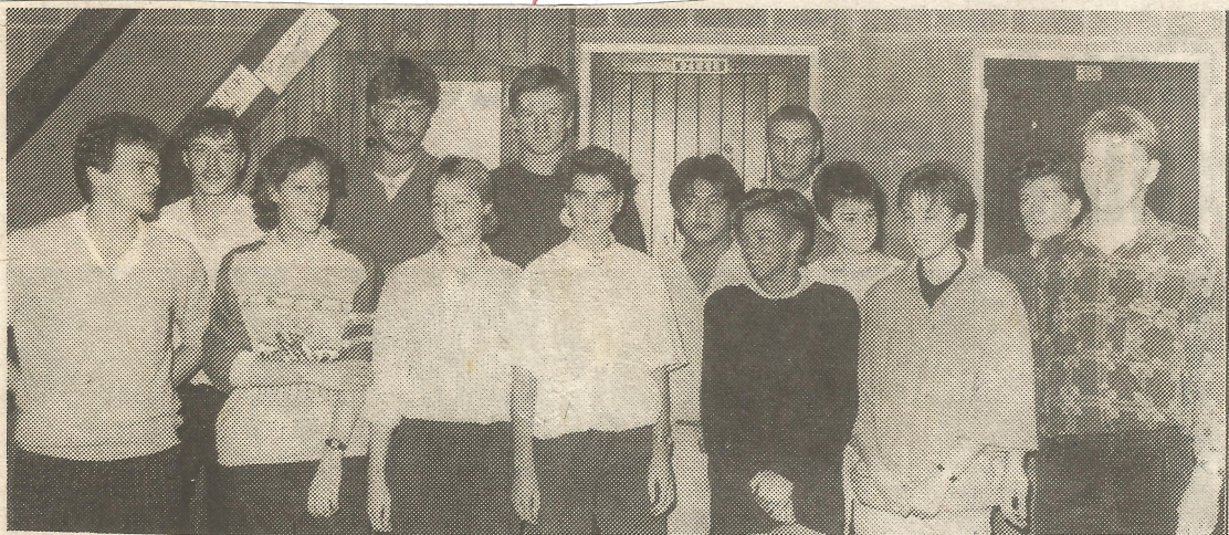
De werkers van de KSJ die de Lichtaartse jeugd een gezonde ontspanning willen geven.